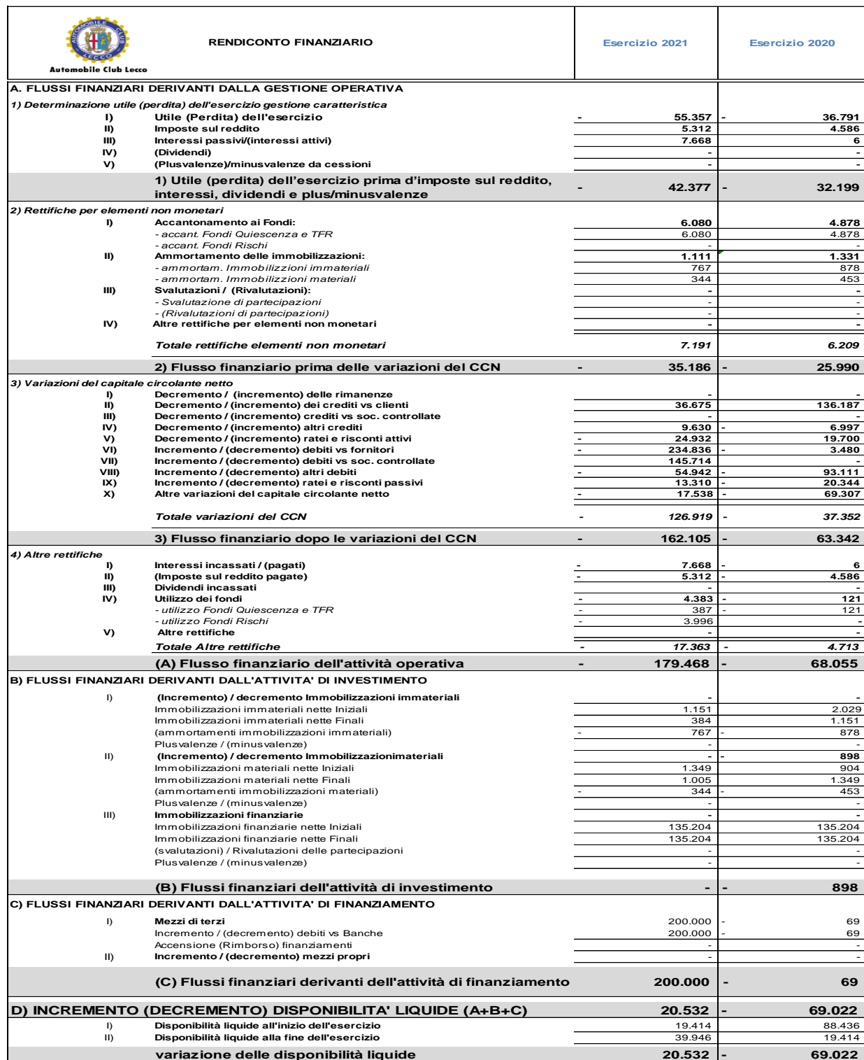
Tabella 2.2.5 – Situazione finanziaria