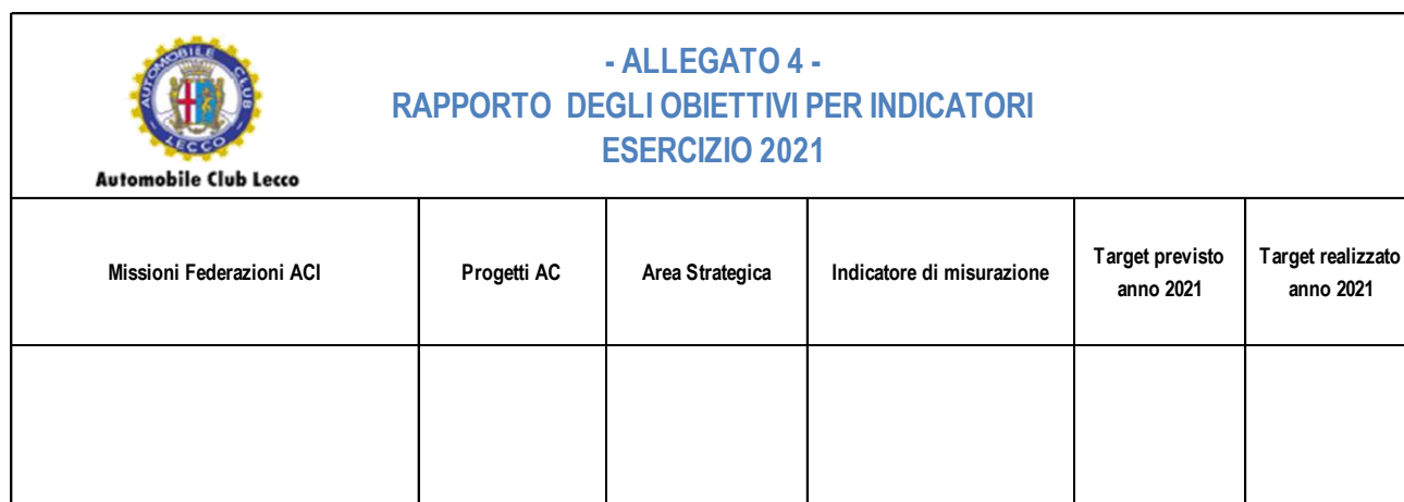
Tabella 4.4.3 – Piano obiettivi per indicatori

Per i motivi sopra citati, anche questa tabella è negativa